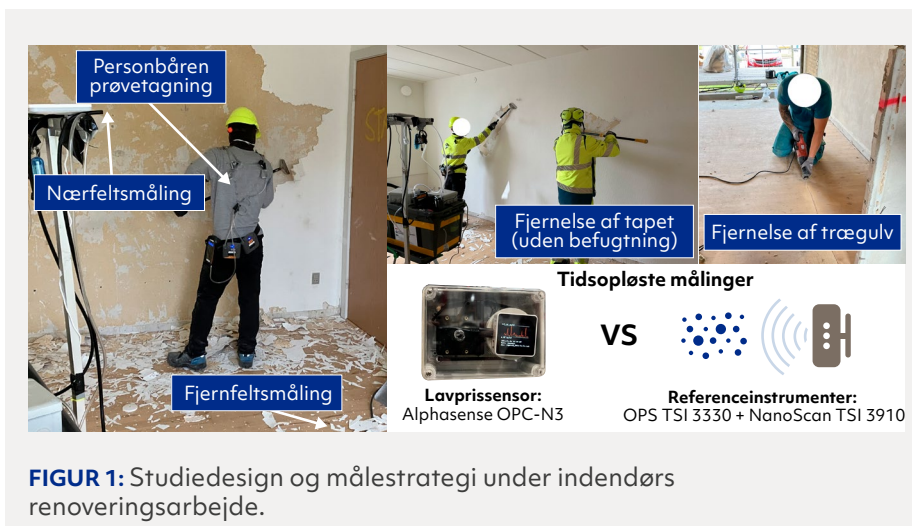
FIGUR 1: Studiedesign og målestrategi under indendørs renoveringsarbejde.

Koncentrationen af partikler i indåndingszonen faldt med 84-99 % under fjernelse af tapet og fejning i områder med befugtede flader,